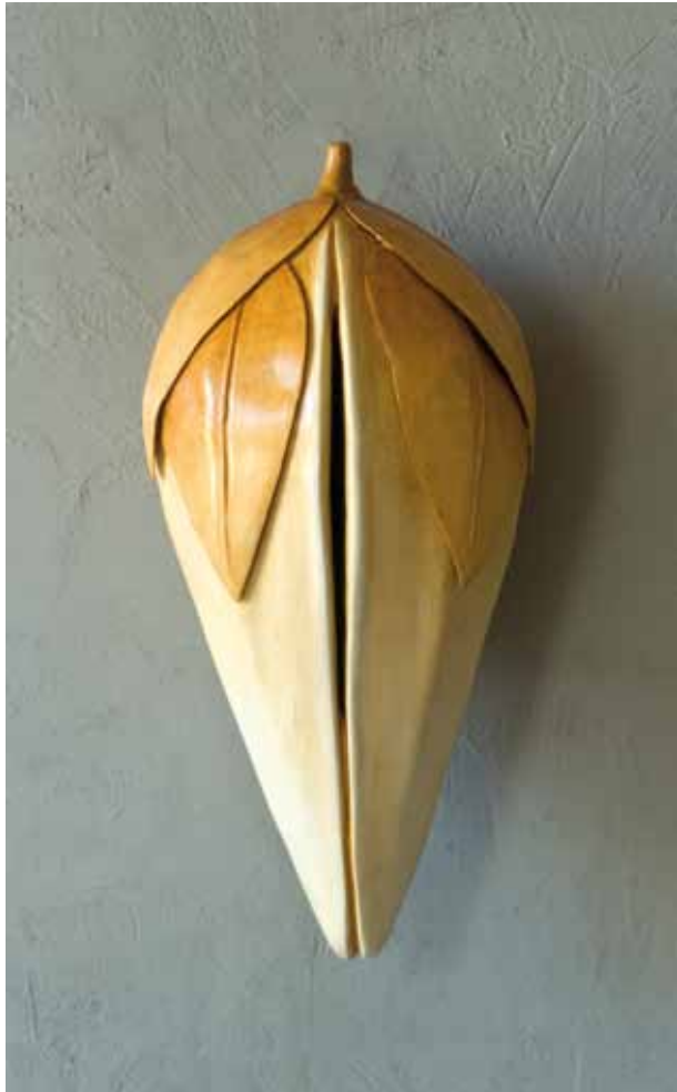
Initius V. 2010 53x25x23 cm. Hierro patinado