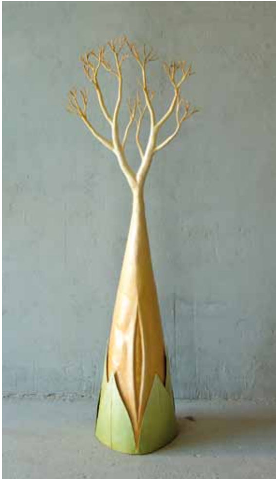
Layla. 2010 150x50x38 cm. Hierro patinado