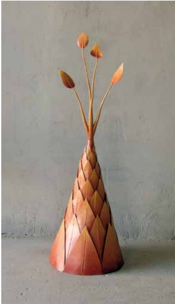
Fruentum II. 2010 126x40x40 cm. Hierro patinado