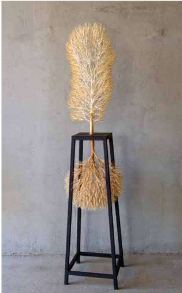
Vidas paralelas. Chopo Balsámico. 2010 190x45x45 cm. Hierro patinado