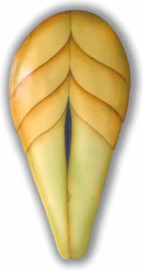
Initius I. 2009 75x37 cm. Mixta, resina poliéster