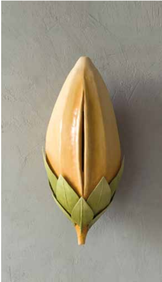
Initius. 2009 48x27x24 cm. Hierro patinado