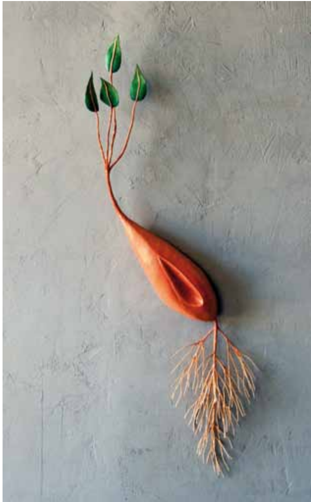
Esencia de brote. 2008 120x45x22 cm. Hierro patinado