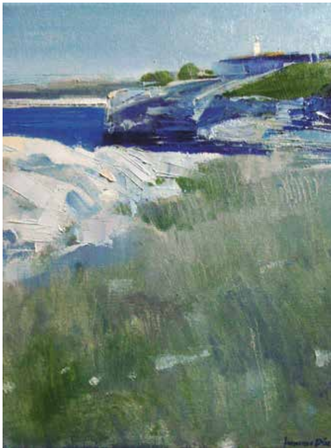
FARO DE SUANCES