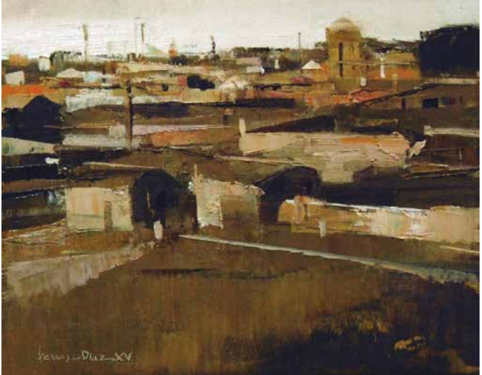
VISTA DE FRÓMISTA